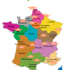
70 équipes en pays francophone, dont 65 en France.

Ce qui forme aujourd'hui «le réseau PROFAMILLE»