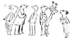
On essaie de «survivre» ou de «limiter les dégâts».

Devant une situation aussi complexe que la schizophrénie, on fait face comme on peut.